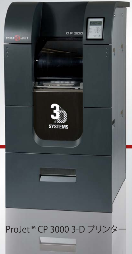
ProJet™ CP 3000 3-D プリンター